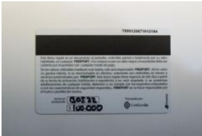
Bono Marca NAF NAF